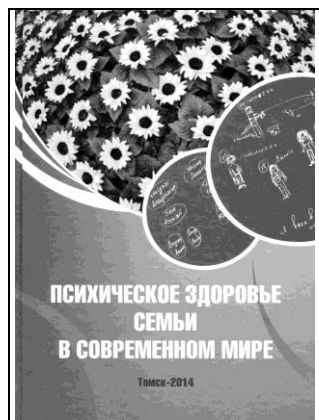
Сборник II Российской конференции с международным участием «Психическое здоровье семьи в современном мире» (2014)

В 2014 г. главными направлениями II Российской конференции с международным участием «Психическое здоровье семьи в современном мире» стали вопросы трансформации семьи, психологических и психиатрических проблем общества, междисциплинарных исследований основных клинико-динамических, социально-психологических, адаптационных и других факторов при болезнях зависимости и психических расстройствах у лиц разного возраста [6, 16].