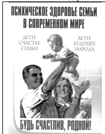
Сборник первой конференции «Психическое здоровье семьи в современном мире» (2009)

ского здоровья населения и программы по сохранению психического здоровья семьи [15].