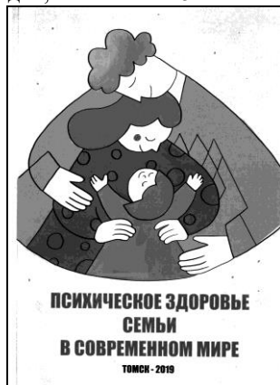
Сборник III Российской конференции с международным участием «Психическое здоровье семьи в современном мире» (2019)

педагоги, аспиранты, ординаторы и студенты вузов; работала делегация из Германии (Дортмунд). Издан сборник, в который вошло более 150 научных трудов, в том числе 5 на английском языке [17].